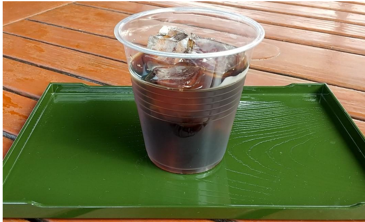
★コーヒー (ICE) 300円