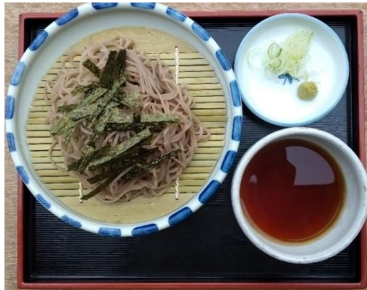
★ざるそば・うどん 各600円