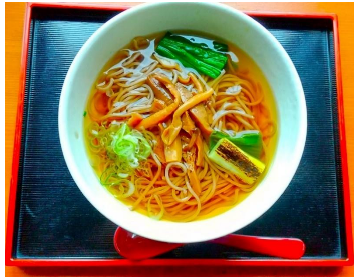
★木ノ子そば・うどん（温） 各750円