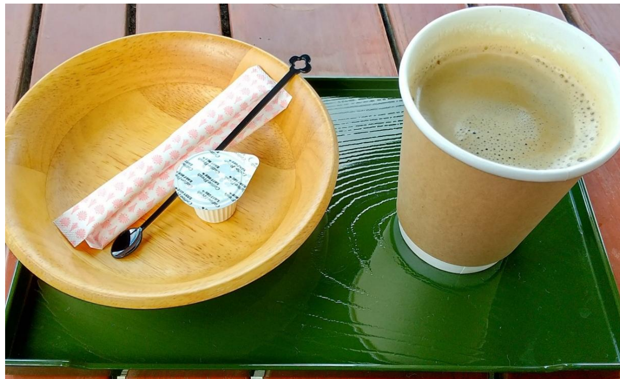
★コーヒー (HOT) 300円