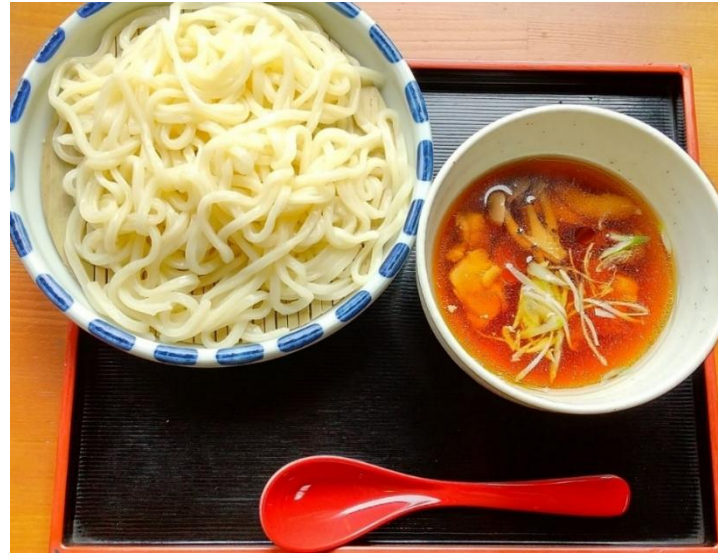
★鶏つけ汁そば・うどん 各800円