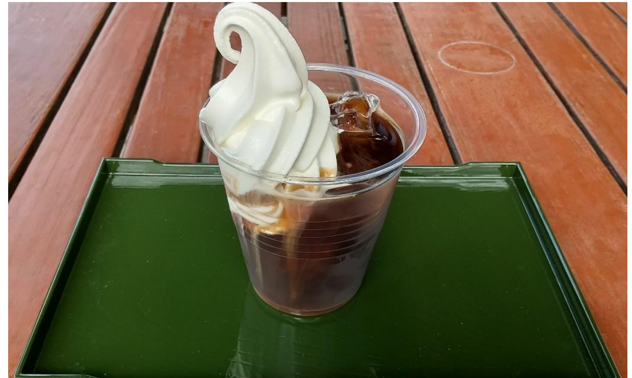
★コーヒーフロート (ICE) 350円