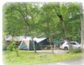
オートキャンプサイト