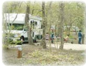
キャンピングカーサイト