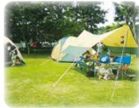
フリーテントサイト