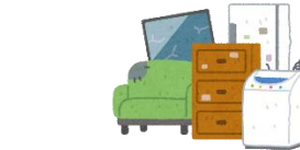
粗大ゴミ・壊れたキャンプ用品など